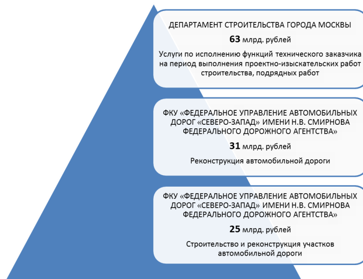
Диаграмма 1 Крупнейшие обсуждаемые закупки, проводившиеся в I квартале 2017 г.